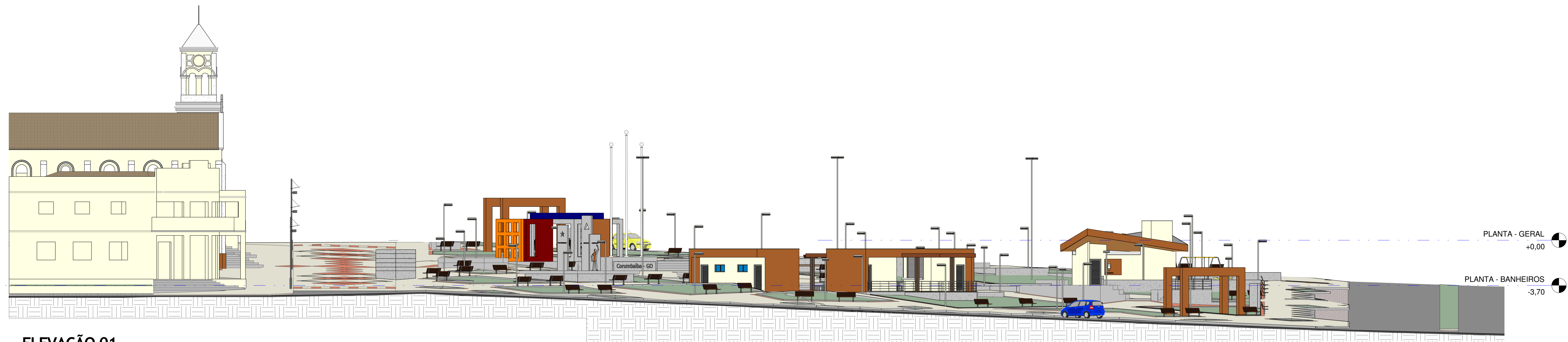
ELEVAÇÃO 01 01 1 : 150