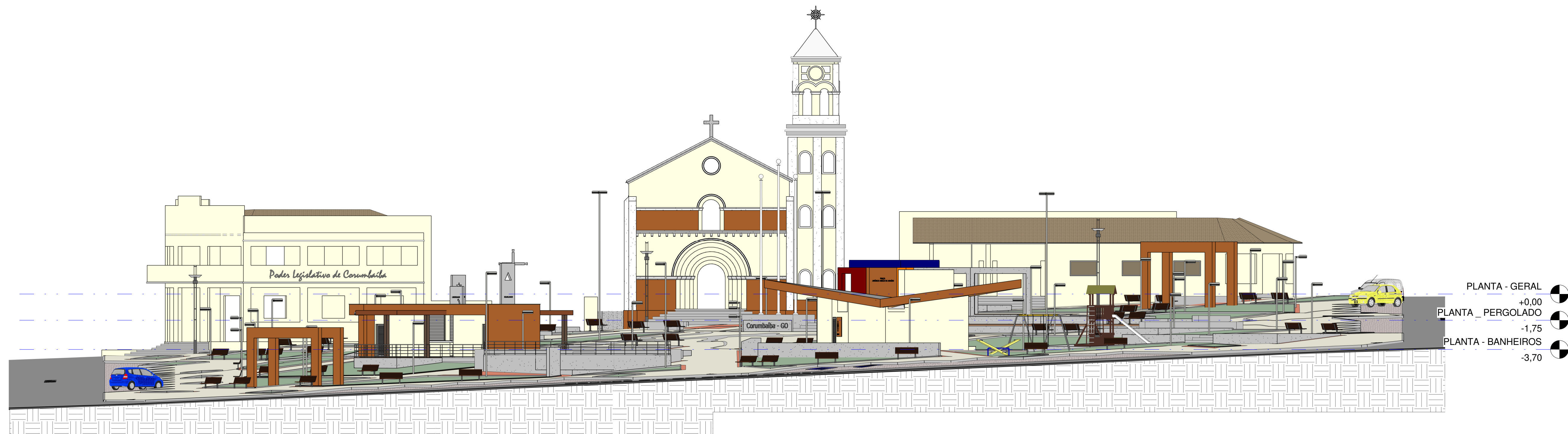
ELEVAÇÃO 03 03 1 : 150